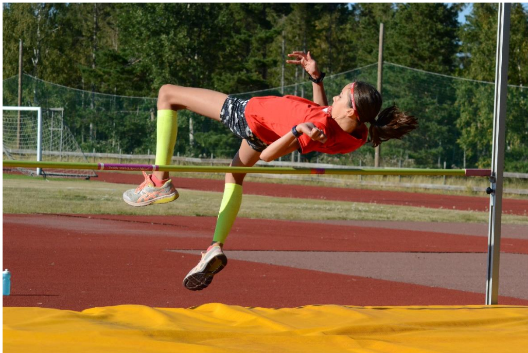
Sommartävling i Lemland.

ÅID:s uppgift är att ansvara för en kontinuerlig och välfungerande friidrottsverksamhet på hela Åland. En viktig uppgift är att följa med lokalföreningarnas friidrottsverksamhet i kommunerna för ungdomar (> 13 år) och hjälpa till vid behov. Inom ÅID Friidrott ordnas kontinuerliga träningar för ungdomar som i föreningarna fått baskunskaper och som är över 13 år. ÅID anordnade under året ett flertal tävlingar på Åland och gjorde det även möjligt att tävla utanför Åland.