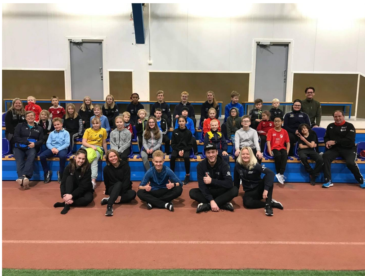
Samlad trupp under träningslägret i Eckeröhallen.

Totalt var det ca 250 aktiva inklusive barn och ungdomar som under året deltagit i den åländska friidrottsverksamheten. Antalet tränare uppgick till 20.