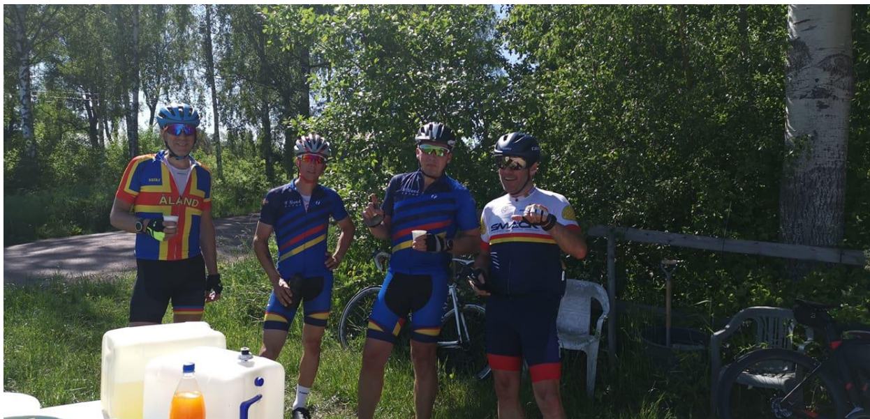
Glada deltagare i "Min Vättern" på Åland.

Under året har vi även arrangerat träningsrundor "söndsgscyklning" runt om på Åland, där vem som helst har kunnat delta.