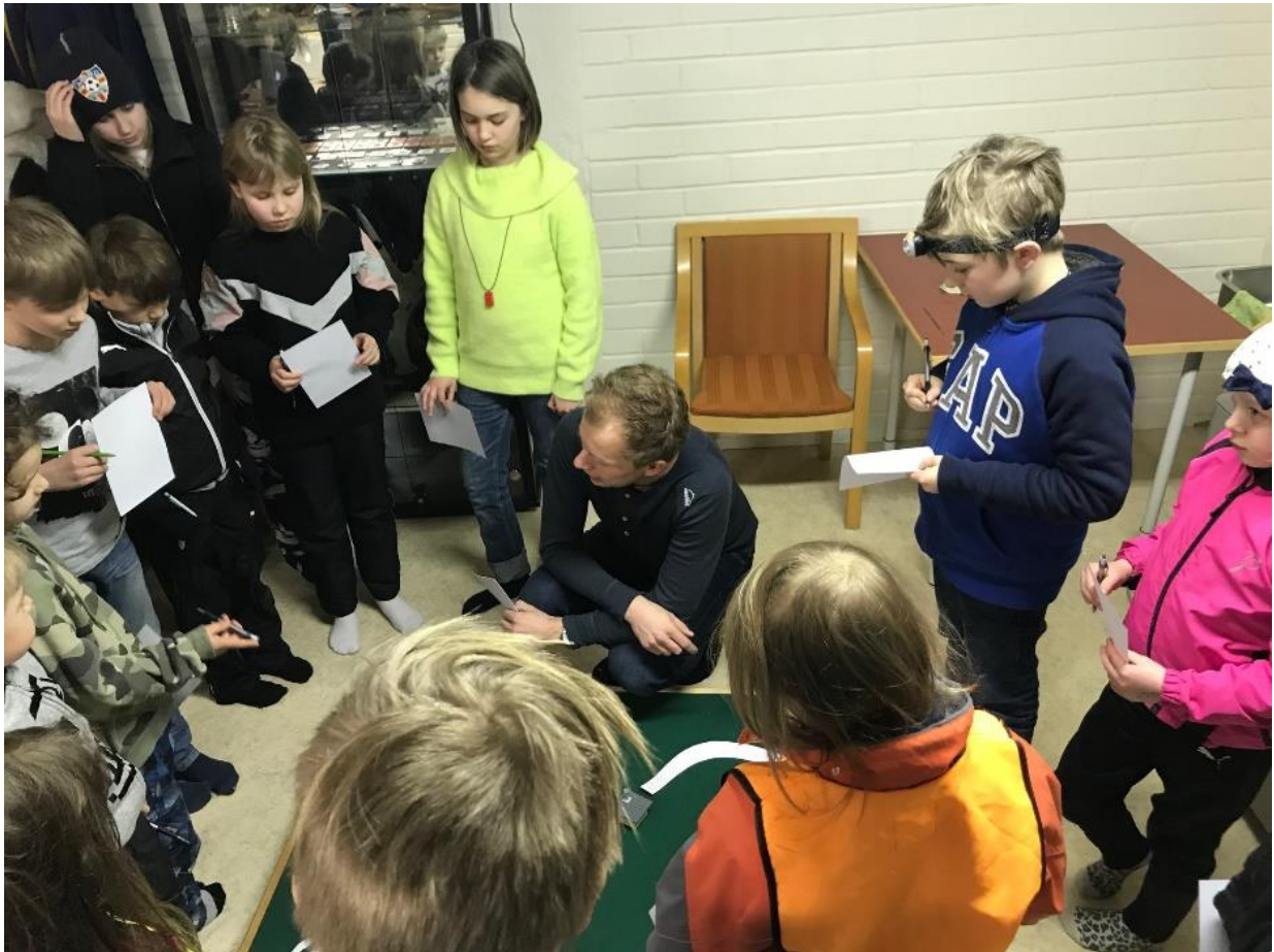
Nybörjarverksamhet i klubblokalen.

Över hela säsongen har drygt 30 barn deltagit i träningar och tävlingar, och även barnens föräldrar har visat intresse för orienteringen.