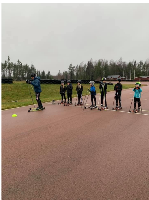
Skidkul på rullskidor på gocartbanan.

Träningsverksamheten har varit igång hela året med undantag av ett uppehåll på våren/sommaren på grund av covid19. Träningarna bestod på lördagar av skidkul för dom yngre och juniorträning för dom äldre. Ett skidläger till Sverige gjordes med juniorerna innan pandemin slog till.