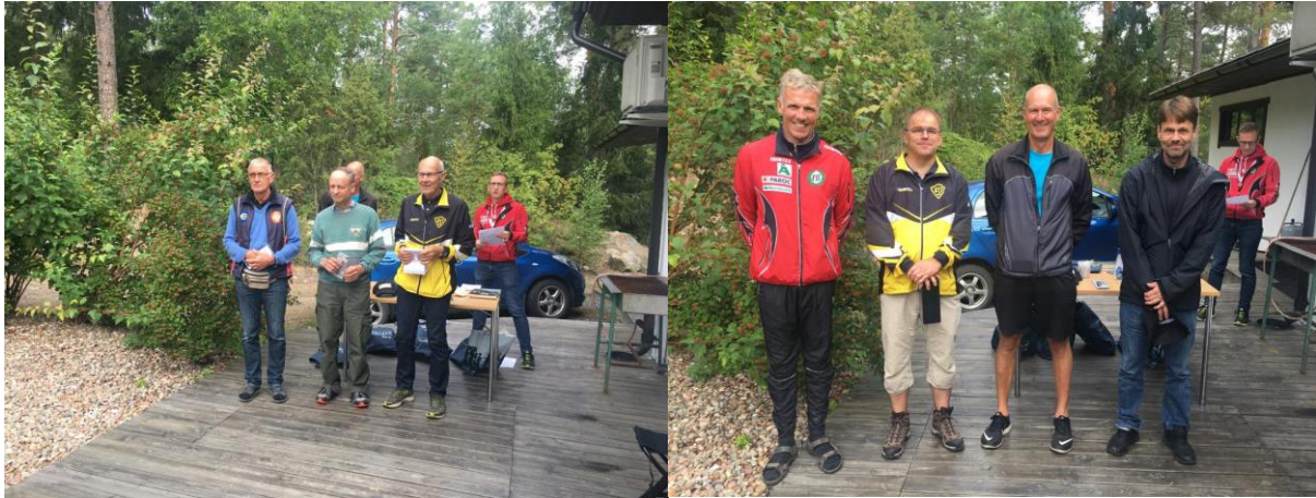
Åland-Åbolandskampen 2020 i Pargas.