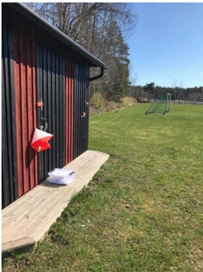
Veckans bana i Lumparland.