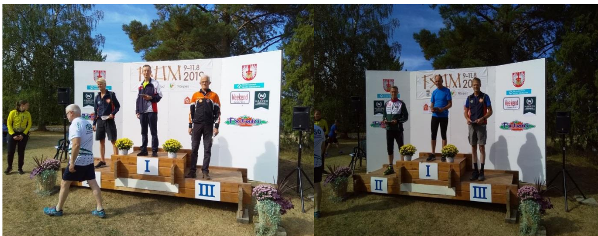
Åländska medaljörer vid FSOM 2019.

Nästa år står IF Åland som arrangör för FSOM med ca 600 deltagare den 7-9.8.2020 med Godby som tävlingscentral.