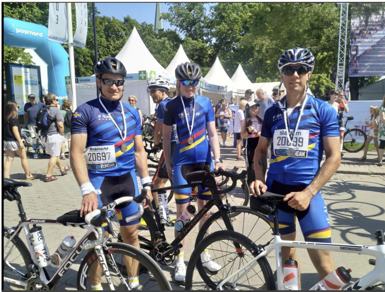
Målgång efter vätternrundan 2019.

Åländska cyklister har även 2019 varit aktiva i lopp utanför Åland, till exempel i cykelvasan, vätternrundan, och Lidinglöppet MTB.