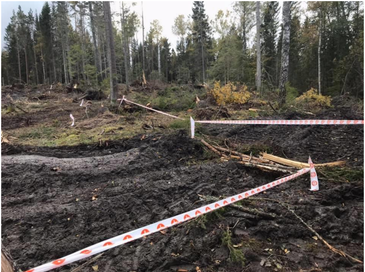
Stormen Alfrida satte sina spår längs med kanonloppsbanan.

ÅID och ÅMF arrangerade det 52:a Kanonloppet (samtidigt den 23:e Ålandsmarschen) lördagen den 12.10.2019. 300 personer sprang och promenerade bansträckningen om 22,5 km från Markusböle till Mariehamn. Totala antalet deltagare i hela evenemanget (inkl. Lilla Kanonloppet och Julleloppet) var 640 personer. Vissa delar av banan måste dras om på grund av stormen Alfrida.