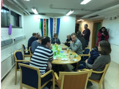
Invigning av nya klubblokalen.

Invigningen av den nya klubblokalen var måndagen den 11 mars med öppet hus för alla. Det bjöds på kaffe, te, saft och tårta.