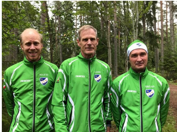
IFK Mariehamn, ÅM-stafett.