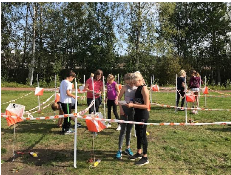
Labyrintorientering under skolidrottsdagarna.

Orienteringen har deltagit i Skolidrottsdagarna, två tillfällen på våren och två tillfällen på hösten. Skolidrottsdagarna för orienteringens del var i år vid Bollhalla där det arrangerade Labyrintorientering och en kort orienteringsbana vid travbanan, båda var mycket omtyckt bland deltagarna. Skolidrottsdagarna når elever i klasserna 3-6 över hela Åland och huvudarrangör är Ålands Motionsförbund.