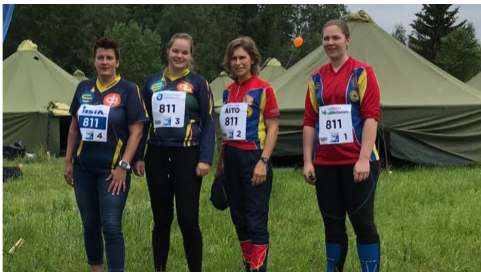
IF Ålands lag i Venla-kavlen.